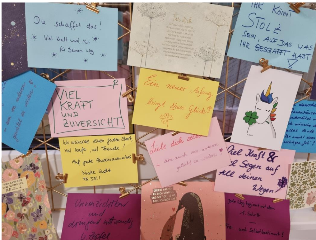
Ein Board voller guten Wünsche - Einweihungsgeschenk vom Team des Büros für Chancengleichheit der Kreisverwaltung Darmstadt-Dieburg