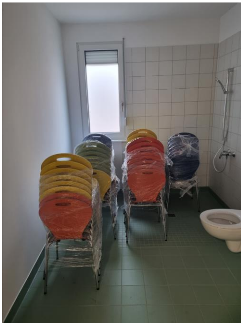
Stühle geparkt im Bad Erdgeschoss