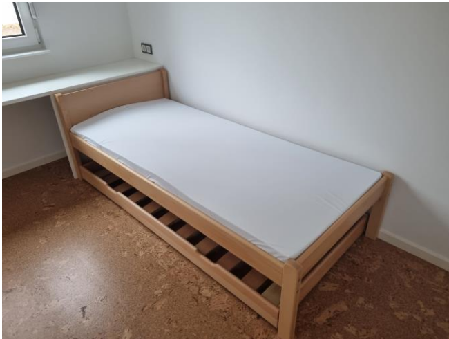
Variables Bett im Familienzimmer

Alles noch nackt und kahl – es ist noch einiges zu tun ☺