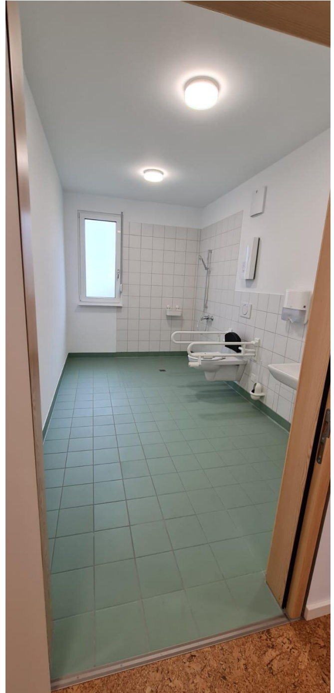
Barrierefreies Bad Erdgeschoss

Alles noch nackt und kahl – es ist noch einiges zu tun ☺